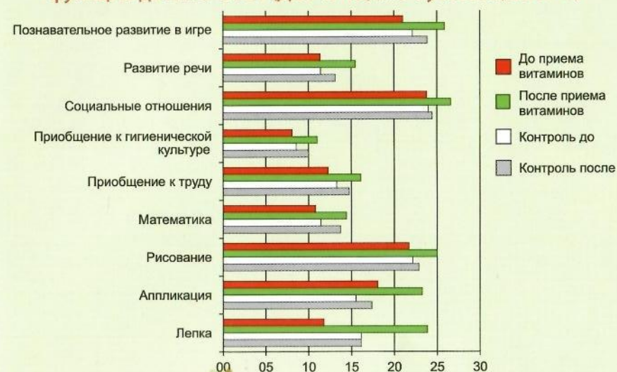
График 1 Влияние витаминизации на когнитивные функции детей 5-6 лет (ДОУ №18, МО Рузаевка, 2007 г.)