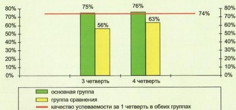
График 2 Улучшение успеваемости Динамика уровня успеваемости (качество) на фоне витаминизации напитками и киселями (МОУ «Лицей №7», Саранск, 2007 г.)

➔ Успеваемость детей на фоне приема напитков была на 13% выше